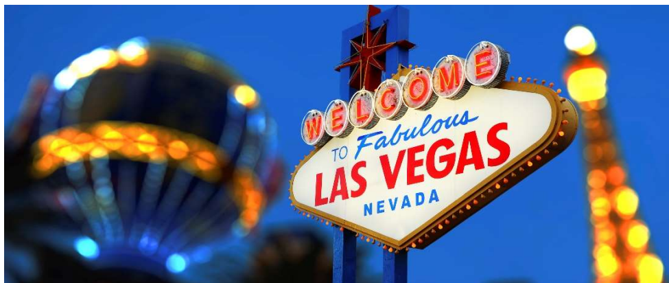
Las Vegas sign