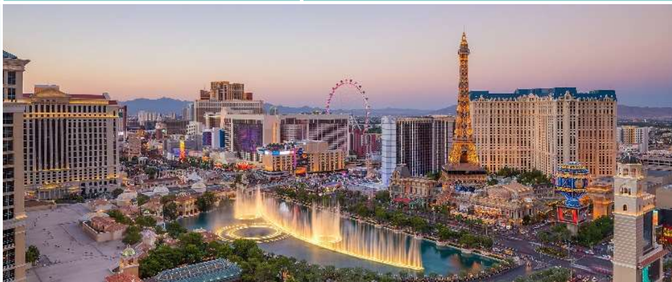
Las Vegas Strip