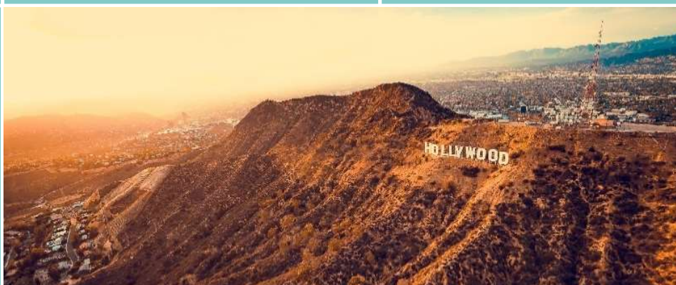
Hollywood Sign