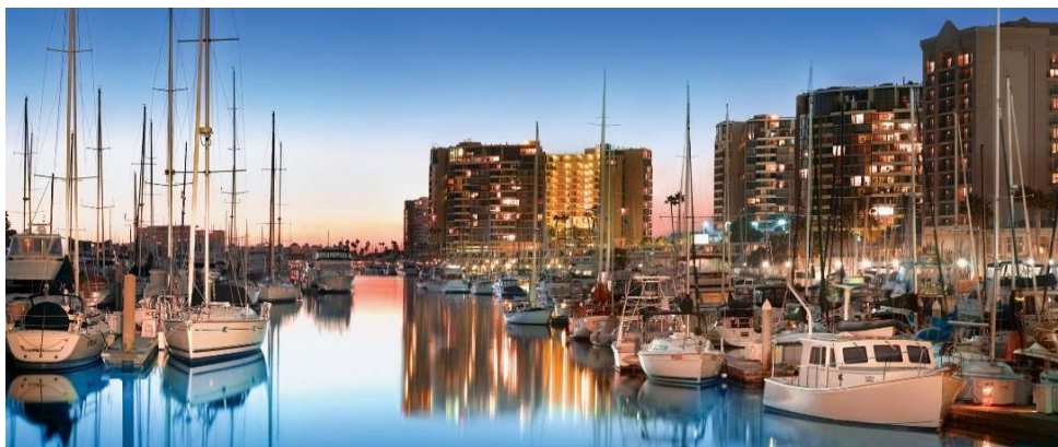
Marina del Rey