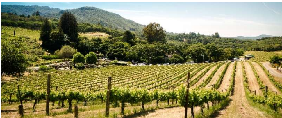
Vignobles, Napa Valley