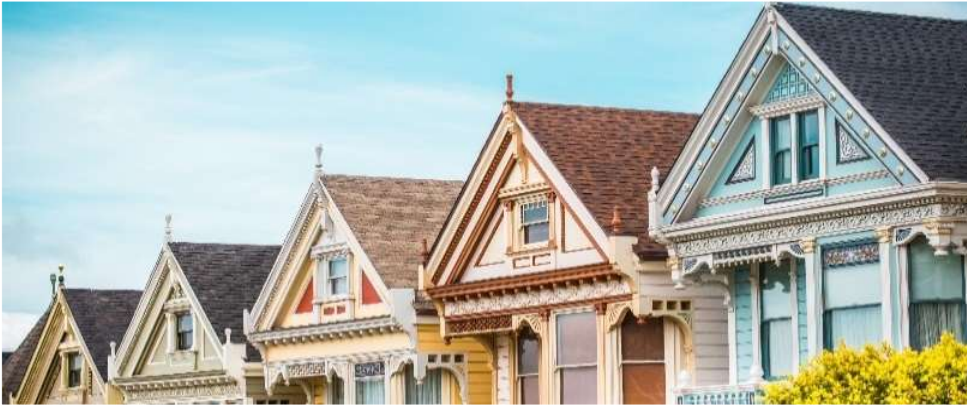
Alamo Square, San Francisco