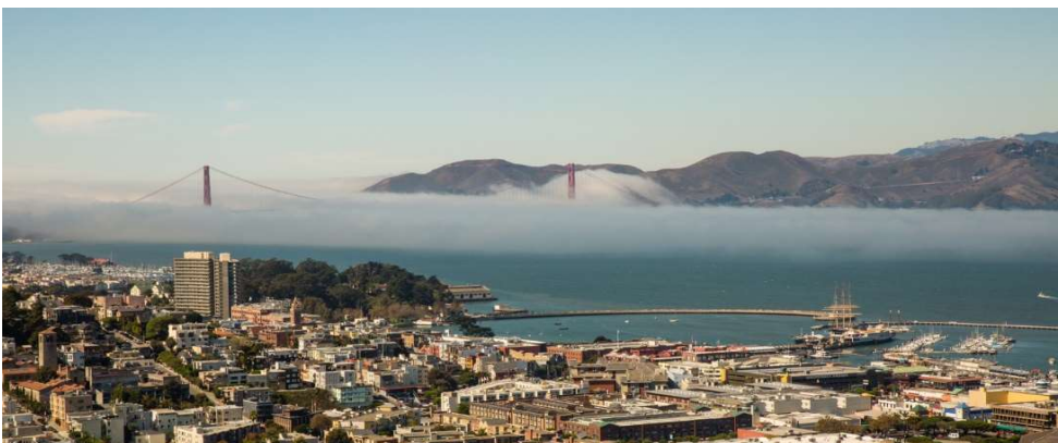
San Francisco

*groupes de 4 à 12 participants; pourboire non inclus, $15 / pers. conseillé