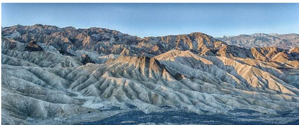
Death Valley

**supp transfert en Cadillac rouge : 136 € | **supp vidéo, 12 fleurs, 12 photos : 92 €