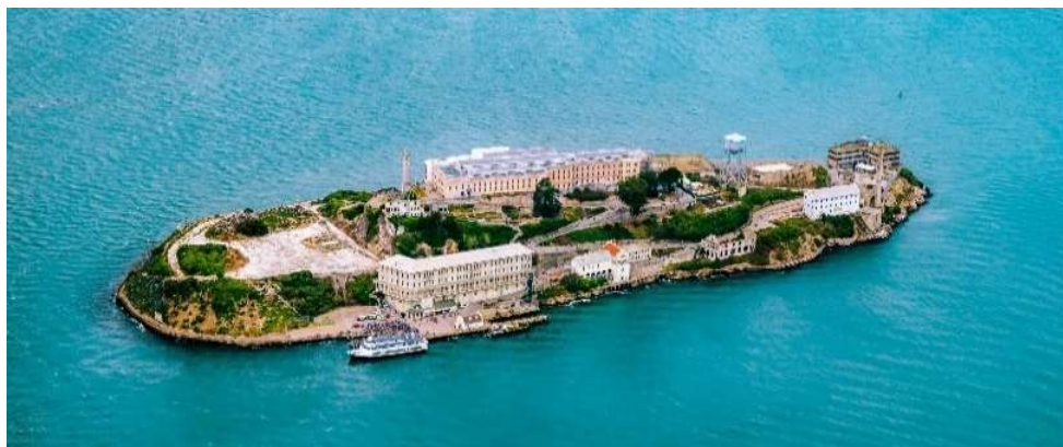
Alcatraz, San Francisco

Infos : Nous consulter pour les jours et heures d'opération - *de 3 à 6 participants; pourboire non inclus, $15 / pers. conseillé