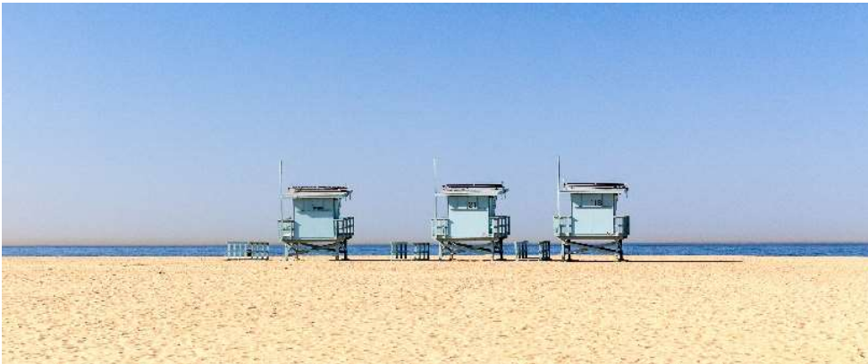
Life Guard Posts Santa Monica Beach

pourboire non inclus, $15 / pers. conseillé