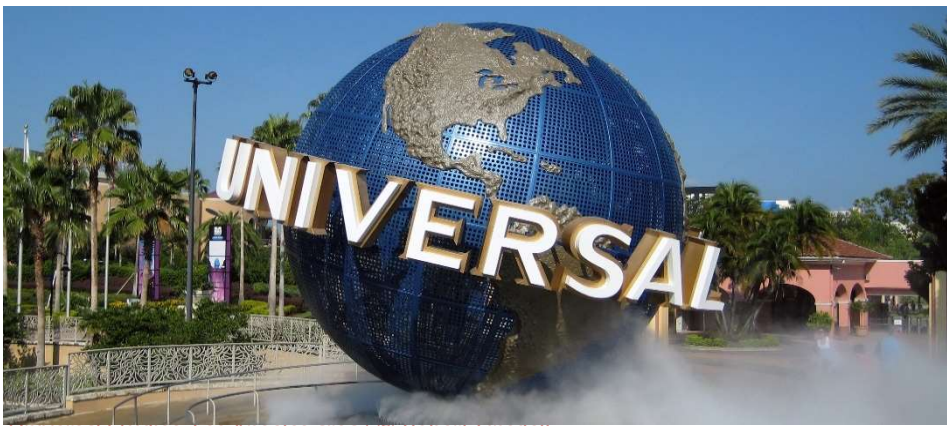
Universal Studios, Los Angeles area