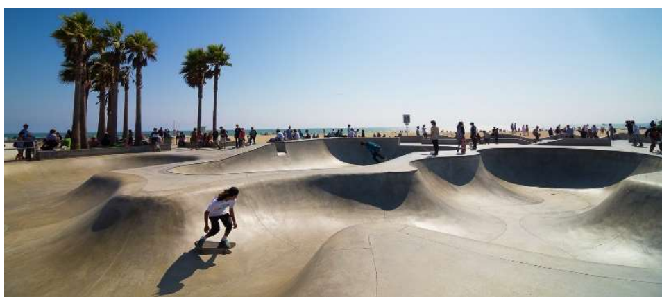
Skate Park, Venice Beach

Ces lieux mythiques, vous aurez sans doute envie de les voir en vrai, mais peut-être aussi vous plaira-t-il de regarder au-delà des symboles et d'en savoir plus sur les petites histoires, les lieux de tournage et les endroits, parfois insolites, qui se cachent derrière le faste de la plus puissante industrie locale.