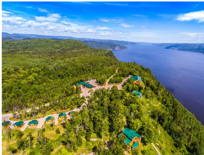
Pourvoirie de Cap au Leste

Séjour au Cap au Leste (nombreuses activités de plein air)