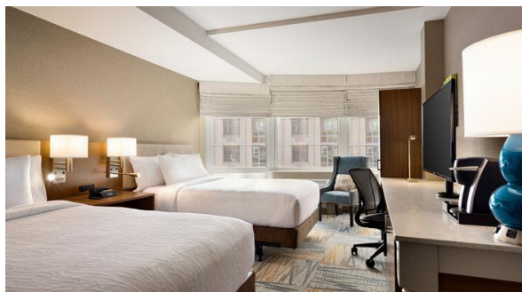
© Hilton garden Inn – New York – Times Square South