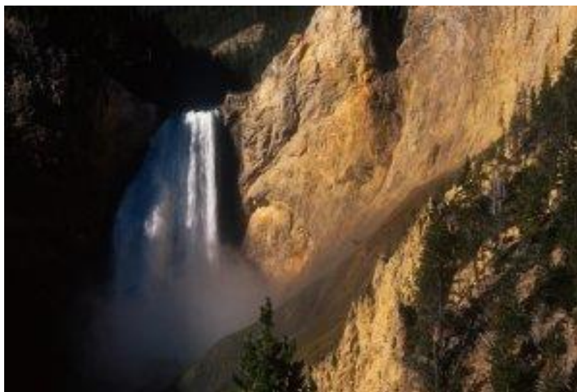
Le Grand Canyon de la Yellowstone