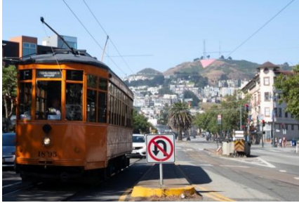
Cable cars in San Francisco ©2015 - Discover America