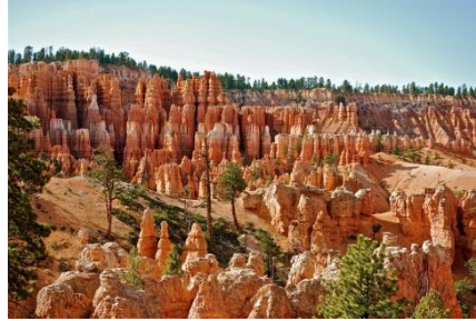
Bryce Canyon National Park Bryce Canyon