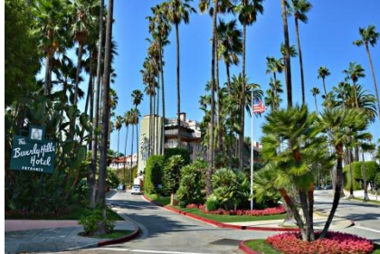
Beverly Hills