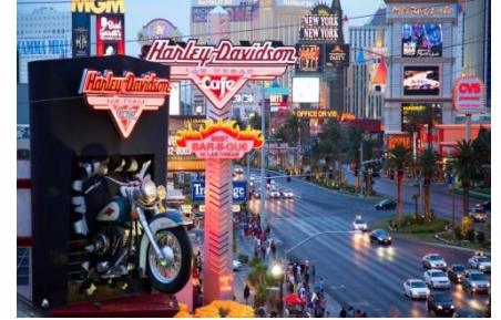
Las Vegas