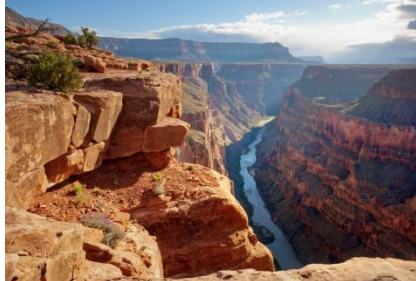
Grand Canyon National Park