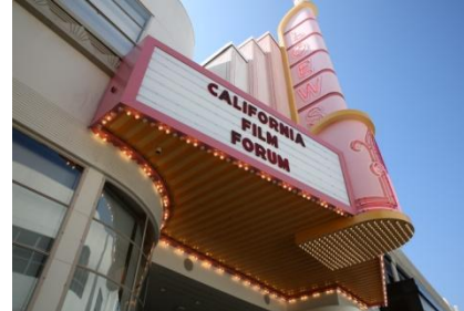
Los Angeles