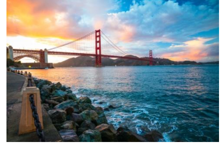
Golden Gate Bridge San Francisco