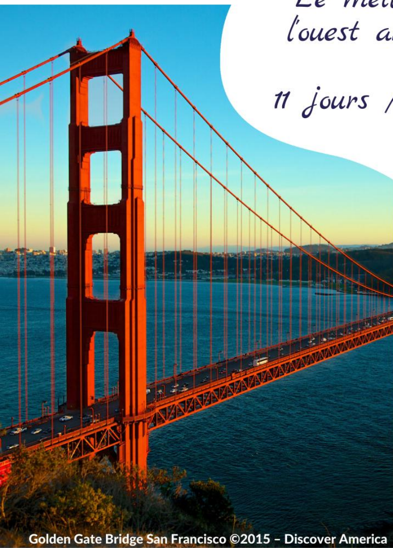
Golden Gate Bridge San Francisco