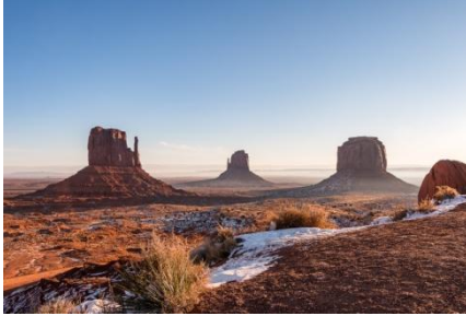
Monument Valley