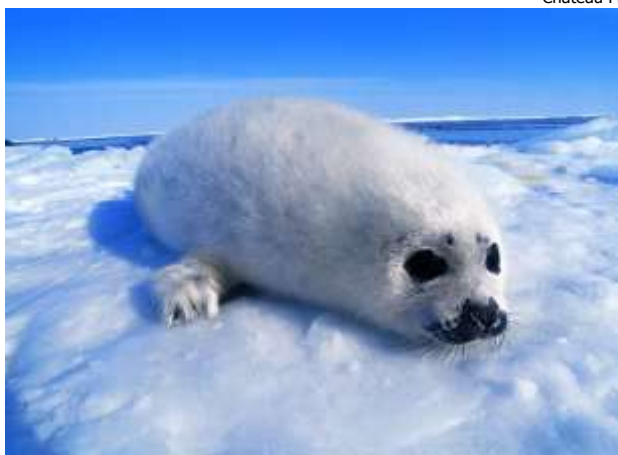
Blanchon banquise