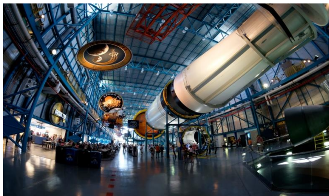
Kennedy space Center

Le prix inclus : le transport aller/retour + l'entrée au KSC + la visite guidée du site.