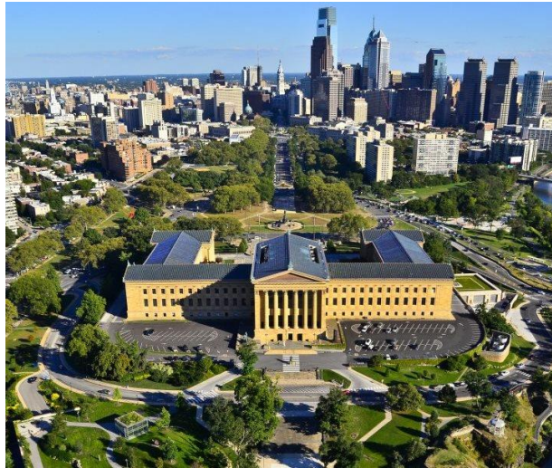
Musée des Beaux – Arts

un centre commercial du type de South Street Seaport à New York et l'on peut admirer quelques beaux vieux bateaux comme la Gazela , un trois-mâts de 1883 et le Becuna , un petit sous-marin.